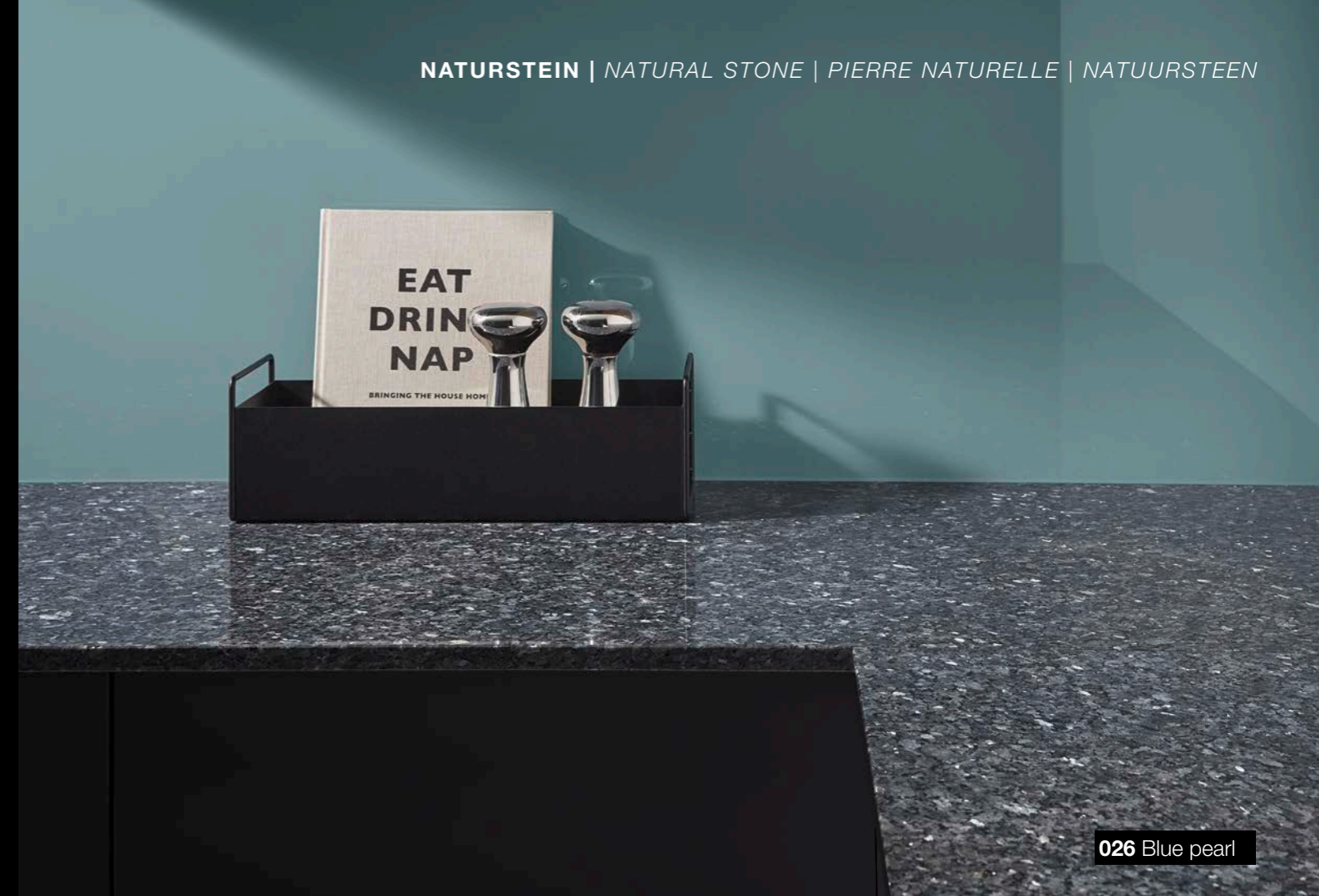
026 Blue pearl

NL Onder enorme druk en bij grote hitte is elke steen in de loop van miljoenen jaren op natuurlijke wijze ontstaan. Daardoor zijn er structuur- en kleurschommelingen, die elke plaat tot een absoluut unicaat maken. Geen wonder dat het koele oppervlak van het natuurproduct uitnodigt tot aanraken en fascineert met zijn unieke tekeningen.