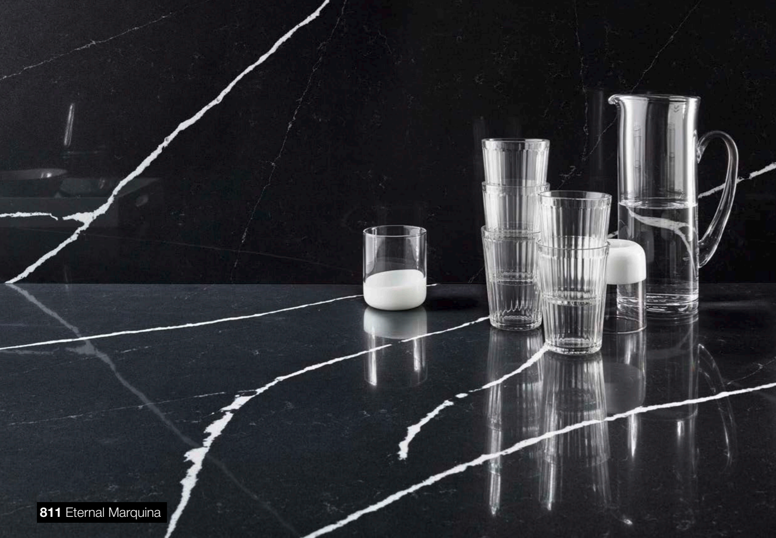
811 Eternal Marquina