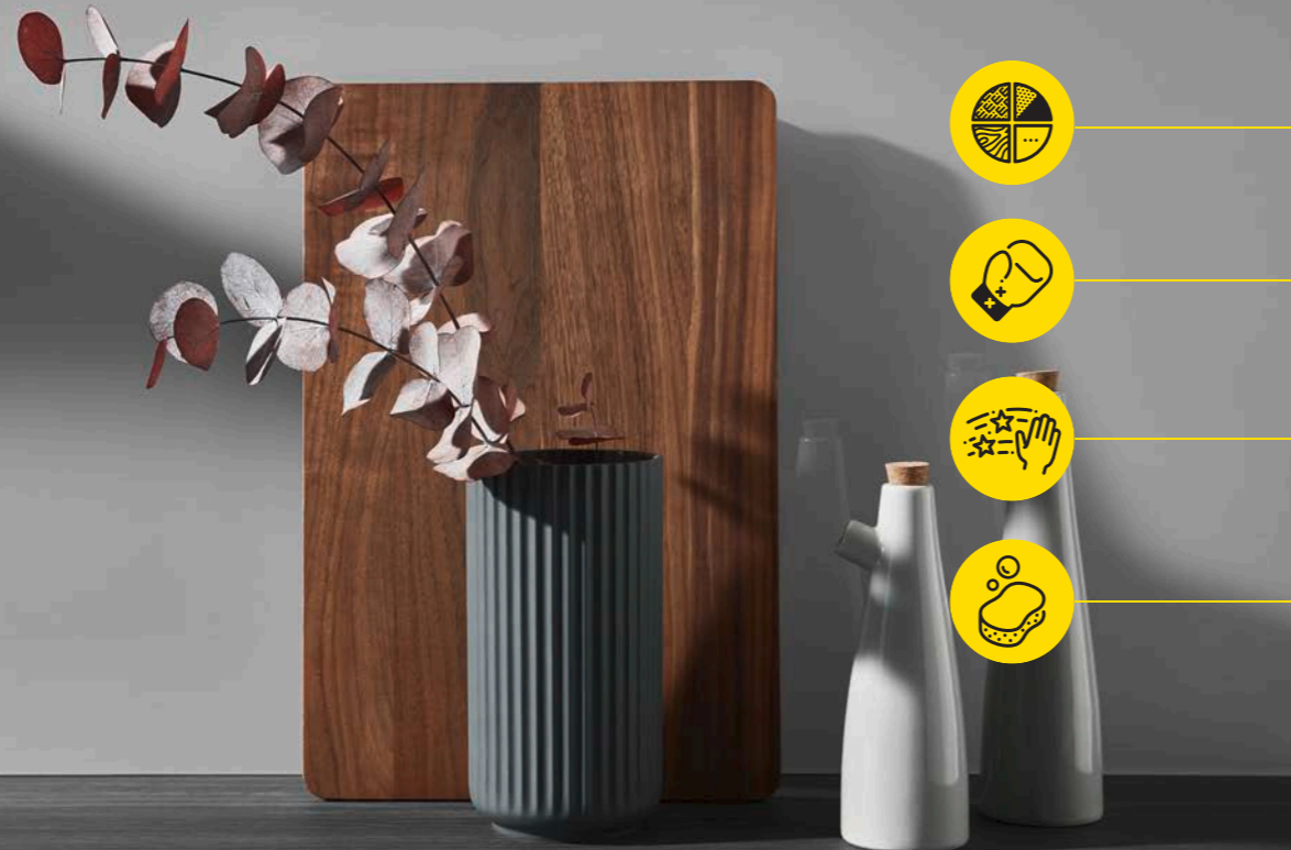
130 Metallic line structure