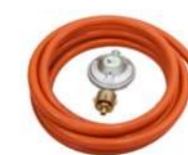
Druckminderer mit Schlauch