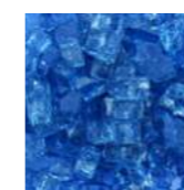
Glassplitt blau 13,5 kg