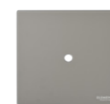
Brennerabdeckung Aluminum ONF05-224LG-E