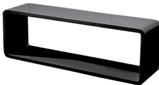
Regalbox Type: 6618/10 (23620142/02)

B/H/T: ca. 120/40/30cm, Schwarz, Hochglanz