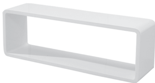
Regalbox Type: 6618/2 (23620142/01)