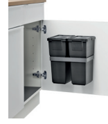
ROTA DOOR DUO 40-2 2 x 8 L Art.-Nr.: 606112

Der Befestigungsbügel für die ROTA DOOR 40er Serie ist von den Abmessungen sowie der Einbauposition für alle Modelle identisch.