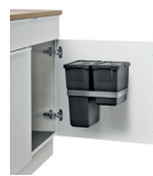
ROTA DOOR DUO 40-2 2 x 8 L + 1 x 5 L Art.-Nr.: 606115