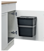
ROTA DOOR SOLO 40-1 1 x 18 L Art.-Nr.: 606111