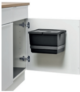
ROTA DOOR SOLO 40-1 1 x 12 L Art.-Nr.: 606113

Clevere Abfall- und Sortiersysteme mit CONCEPT von VOGT