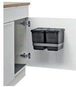
ROTA DOOR DUO 40-2 2 x 5 L Art.-Nr.: 606114